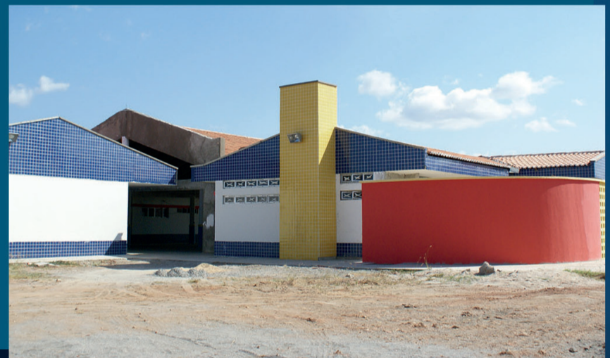
Centro Pró-infância - Bairro Jardim Bandeirante