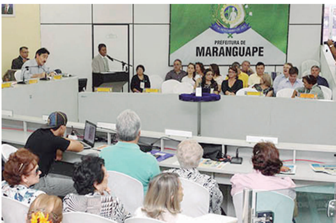
Mais de 400 comunicadores marcaram presença no Encontro de Maranguape