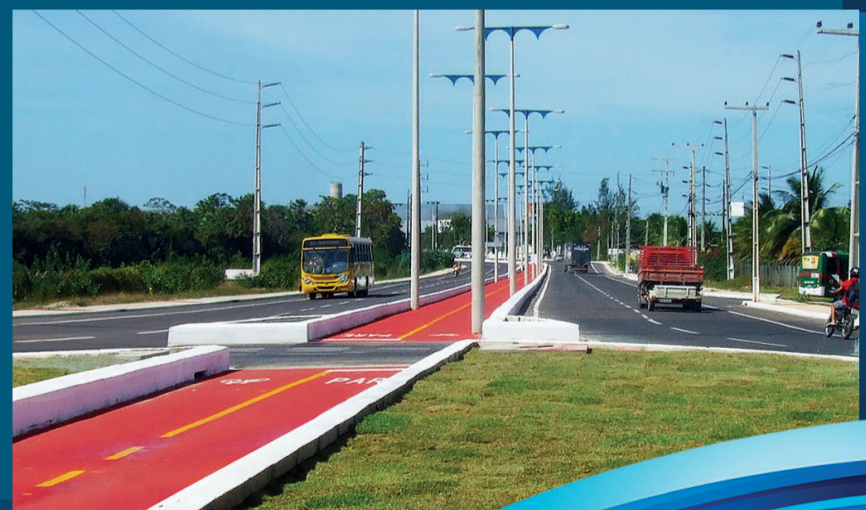
Av. José Alencar Distrito Industrial