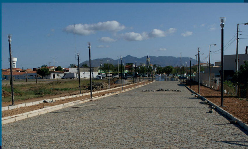
Av. Francisco Alves Marinho - Bairro Jereissati I