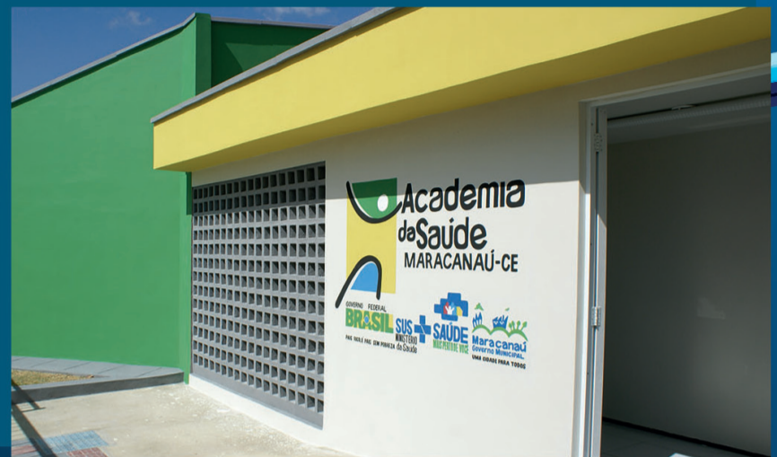
Academia da Saúde - Bairro Timbó