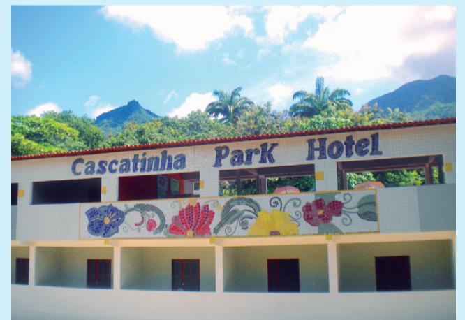
Venha ao Cascatinha Park Hotel e encontre a felicidade

É esse nosso diferencial, nosso maior patrimônio, nossa verdadeira vocação, poder proporcionar um momento de