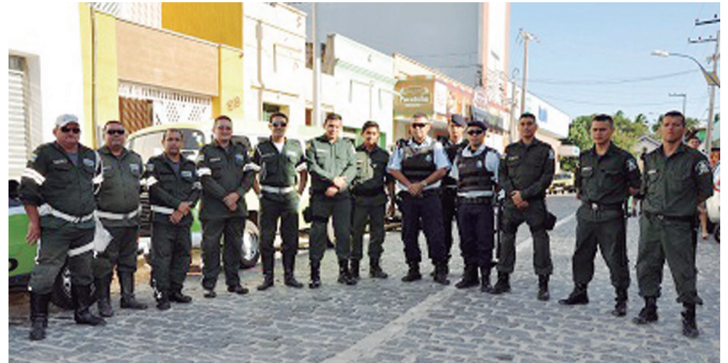
Blitze especiais darão mais segurança aos pacatubanos