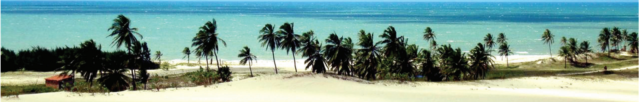
Praia do Cumbuco uma das mais visitadas pelos estrangeiros

N ão há dúvidas de que nosso Ceará tem muito a oferecer a quem passa por aqui. A exemplo disso, contamos com as mais belas praias: a de Canoa Quebrada em Aracati, Jericoacoara em Jijoca, Praia das Fontes em Beberibe entre outras. Além desta realidade, que encanta principalmente quem nos visita, não podemos esquecer que as regiões metropolitanas de cada estado têm um papel importante na oferta de atrativos turísticos.