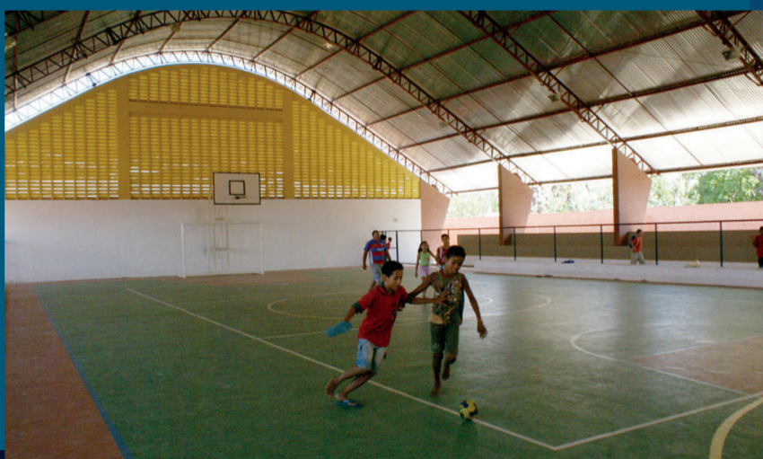
Quadra Poliesportiva da Escola Maria de Lourdes Silva Bairro Alto Alegre