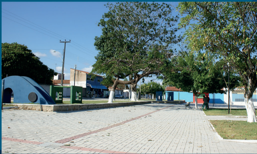
Praça Carlos Roberto Holanda Gomes - Bairro Luzardo Viana

acredita no futuro e investe no presente do cidadão.